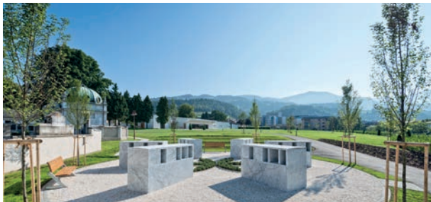
Im Herzen des Friedparks befindet sich die „Blume des Lebens“

Im Friedpark besteht auch die Möglichkeit, Urnen in Urnenerdgräbern oder speziell gestalteten Urnennischen zu bestatten. So sind mit der „Blume des Lebens“ 36 weitere Urnennischen errichtet worden. Dieses Angebot wird laufend erweitert.