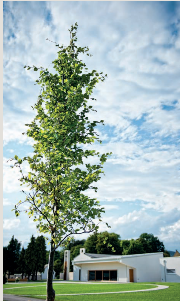
Frieden finden – im Schatten eines Baumes.